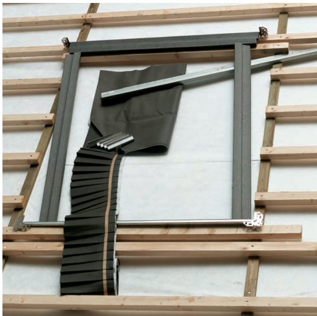
BDX izolacijski set se sastoji od termoizolacijskog okvira i hidroizolacijske maramice